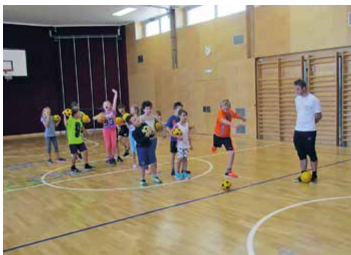
Jede Klasse hatte eine Schnupperstunde – am Bild die 3.a Klasse.