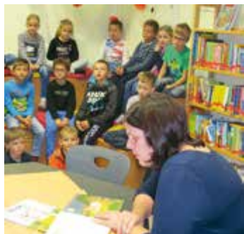
Auf diesem Foto liest Frau Hollauf vom SPAR-Markt.