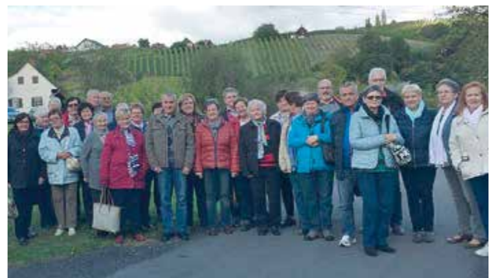
Ein Teil der reiselustigen Ortsgruppe Maria Rojach des Pensionsistenvereines bei ihrem Abschlussausflug „Fahrt ins Blaue“.

Einen wunderschönen Abschlussausflug unternahm die PVÖ Ortsgruppe Maria Rojach. Bei herrlichem Wetter ging es nach Mureck zur Schiffsmühle. Nach einer interessanten Führung fuhr man weiter nach Klöch zu einem ausgezeichneten Mittagessen ins GH Palz. Die schöne gesellige Tagesfahrt ließ man mit einem Einkehrschwung bei Jause und Musik in der Buschenschank Pugl am Nestelberg ausklingen, ehe es wieder Richtung Heimat ging.