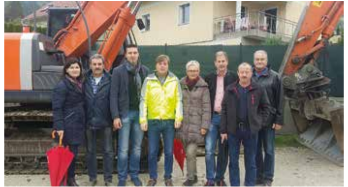
Potschweg – Baubeginn.

Dieses Referat ist eines der zeitintensivsten aber auch spannendsten und wird durch Kleinigkeiten, die umgesetzt werden können bzw. sofort erledigt werden können, auch sicherer. Leider sind die finanziellen Mittel in diesem Bereich gering im Gegensatz zu dem, was noch umgesetzt werden müsste. Ein Teilprojekt, welches gerade in Arbeit bzw. Fertigstellung ist, ist das erste Paket des Straßensanierungskataloges. Dieser wurde, mit dem Bauausschuss nach Bereisung des Gemeindegebietes und stundenlang Besprechungen, nach bestem Wissen und Gewissen sowie nach vorhandenen finanziellen Möglichkeiten gereiht. Somit war das 1. Paket: Potschweg/Siedlung und ein Teilstück der Godinger Straße noch 2016 umsetzbar. Ich will auf die nächsten Projekte im Jahr 2017 nicht vorgreifen, aber es wird noch in diesem Jahr mit der Sanierung eines Teilabschnittes der Kienberger Straße begonnen und soweit es möglich ist vorbereitet, sodass das Befahren im Winter möglich ist. Im kommenden Jahr wird dieser Teilabschnitt so schnell als möglich fertiggestellt.