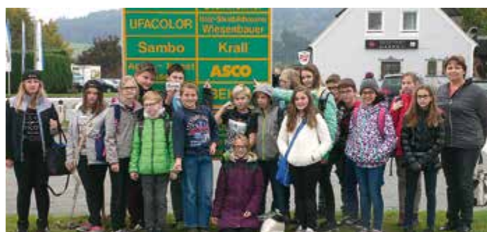
Die zweite Klasse besuchte die Firma ASCO in der IGZ St. Andrä Süd und lernte die Berufsfelder Metalltechnik und Anlagenbau kennen.